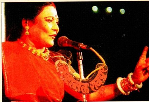
तीजन बाई (पंडवानी गायिका)