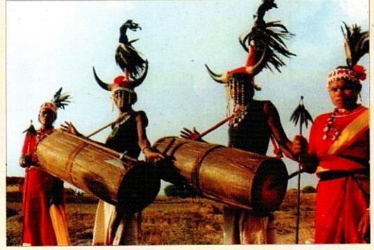
आदिवासी नृत्य (बस्तर)